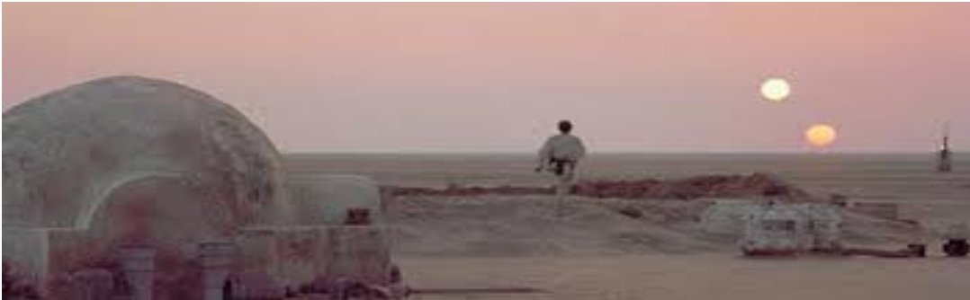
La guerra de las galaxias George Lucas